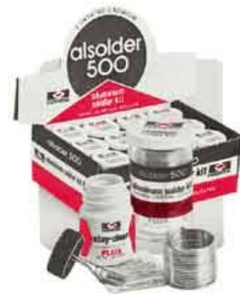
ALSOLDER 500 Soldadura para aluminio