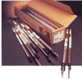
Varillas para soldar de 51 cms . (0%, 2%, 5%, 15%)