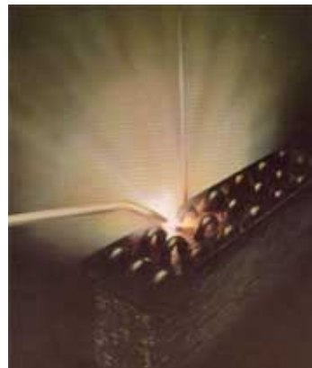
Soldadura en proceso (serpentines/radiador)